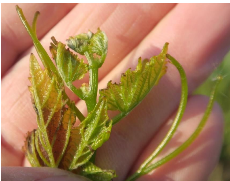
Bild 3: gebräunte Ränder an den Blättern zeigen leichte Frostschäden an, die Triebspitze ist noch aktiv; WBR